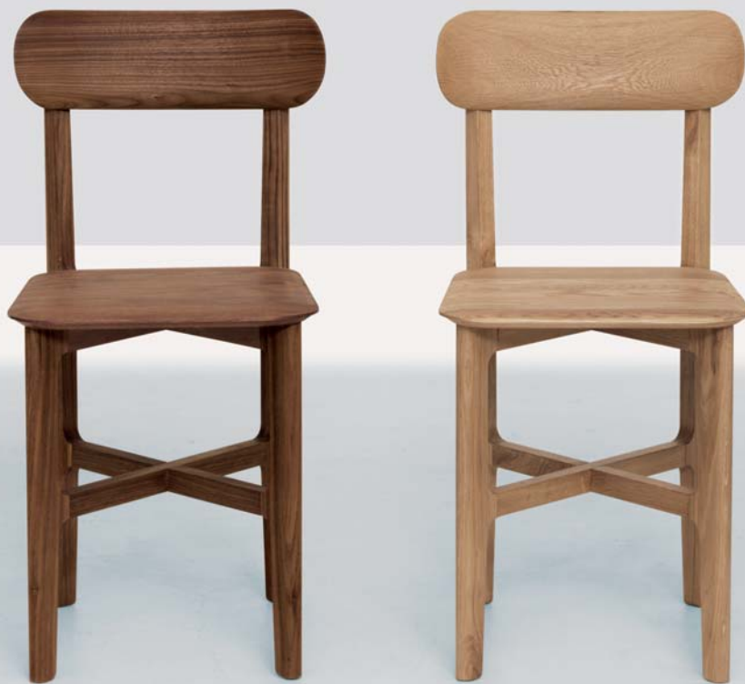
1.3 CHAIR, amerikanischer Nussbaum und Eiche massiv

Das Ensemble der 1.3 Kollektion besteht aus Stuhl, Hocker und Barhocker. Das prägnanteste Merkmal des zierlichen, leichten 1.3 CHAIR ist die hauchdünne Anmutung des Sitz- und Rückenteils durch seine besonders feine Konturlinie. Die Sitzfläche sieht aus als würde sie schweben. Sie erhält eine optische Weichheit durch die „Pad“-Optik. Aufgrund seiner raumsparenden Formen und der stabilen Konstruktion eignet sich dieses Ensemble besonders für das Großstadttambiente – kleine Restaurants, Bars und Bistros.