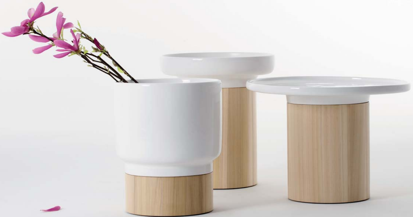
APU, Keramik mit Holzsockel