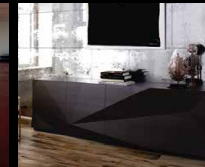
CRASH design Ferruccio Laviani