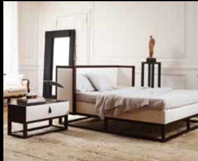
WIEN design Ferruccio Laviani