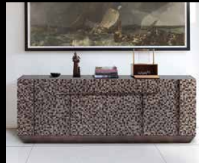
SENECA design Ferruccio Laviani