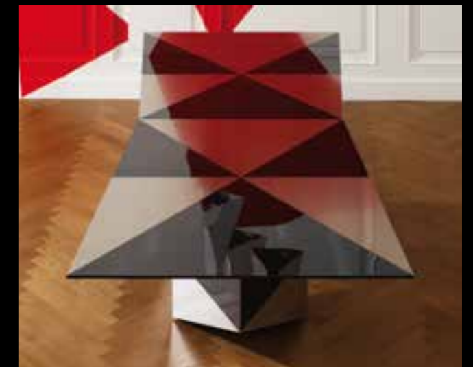
ARLEQUIN design Ferruccio Laviani