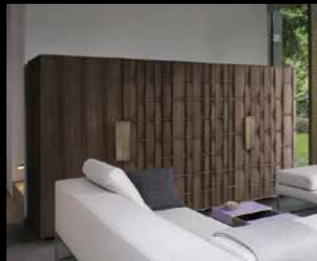
CELTIC design Ferruccio Laviani