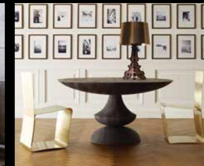
KIA design Giuseppe Viganò BIRIGNAO design Ferruccio Laviani