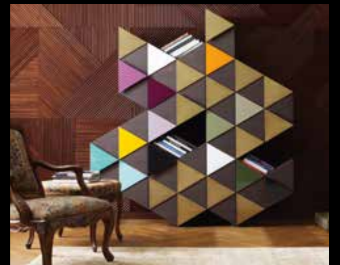
ARLEQUIN design Ferruccio Laviani