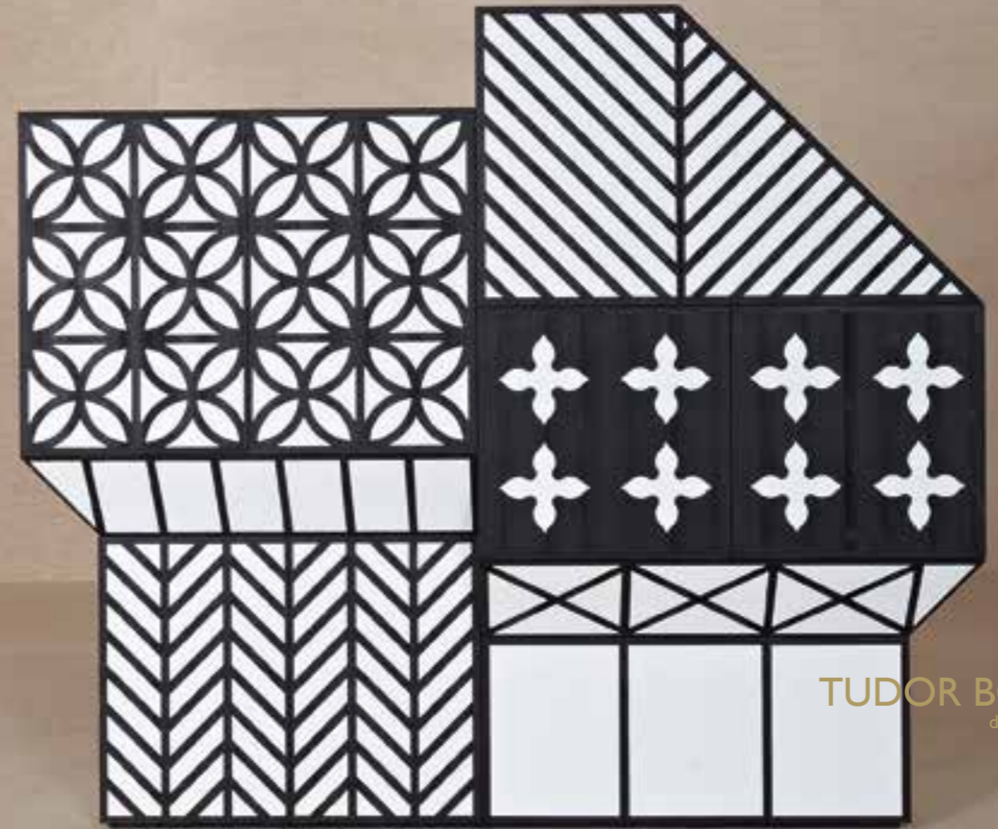
TUDOR BONANZA design Ferruccio Laviani