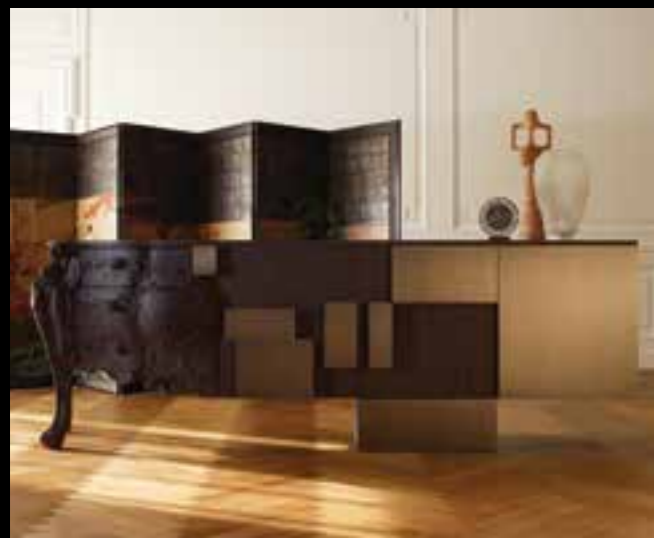
EVOLUTION design Ferruccio Laviani