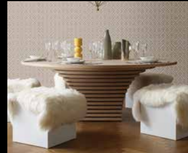
PALERMO design Ferruccio Laviani