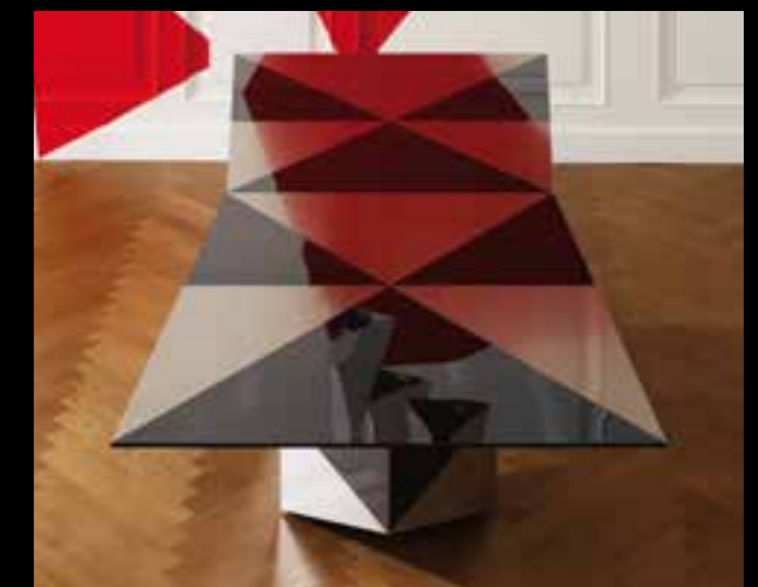
ARLEQUIN design Ferruccio Laviani