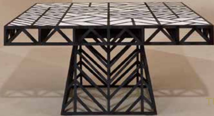
TUDOR BONANZA design Ferruccio Laviani