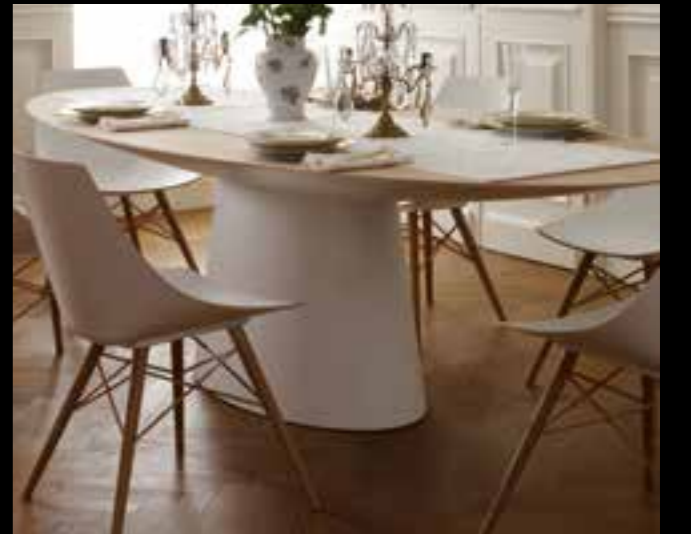
GLEE/UFO design Ferruccio Laviani