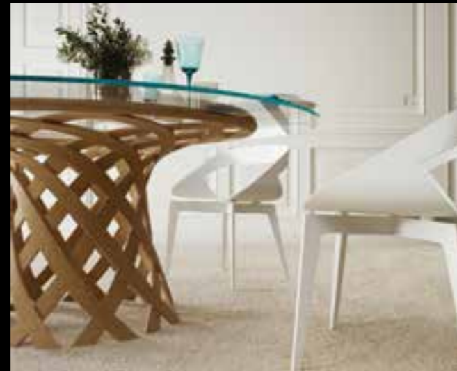
NASSA design Ferruccio Laviani C-130 design G. D. Harcourt