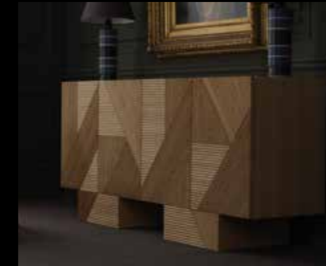
STRIPES design Ferruccio Laviani