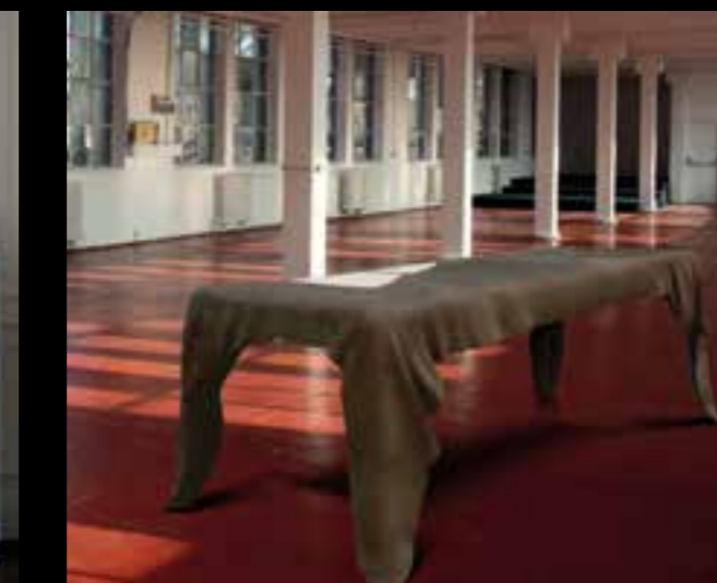
TWAYA design Ferruccio Laviani