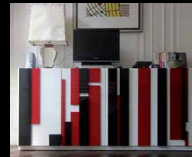
MODULAR design Ferruccio Laviani