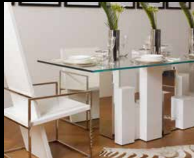
STRAIGHT/CITY design Ferruccio Laviani